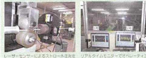
レーザーセンサーによるストロー径測定 リアルタイムモニターでオペレーティング